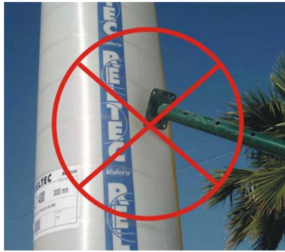
No aplicar el puntal directamente sobre el encofrado